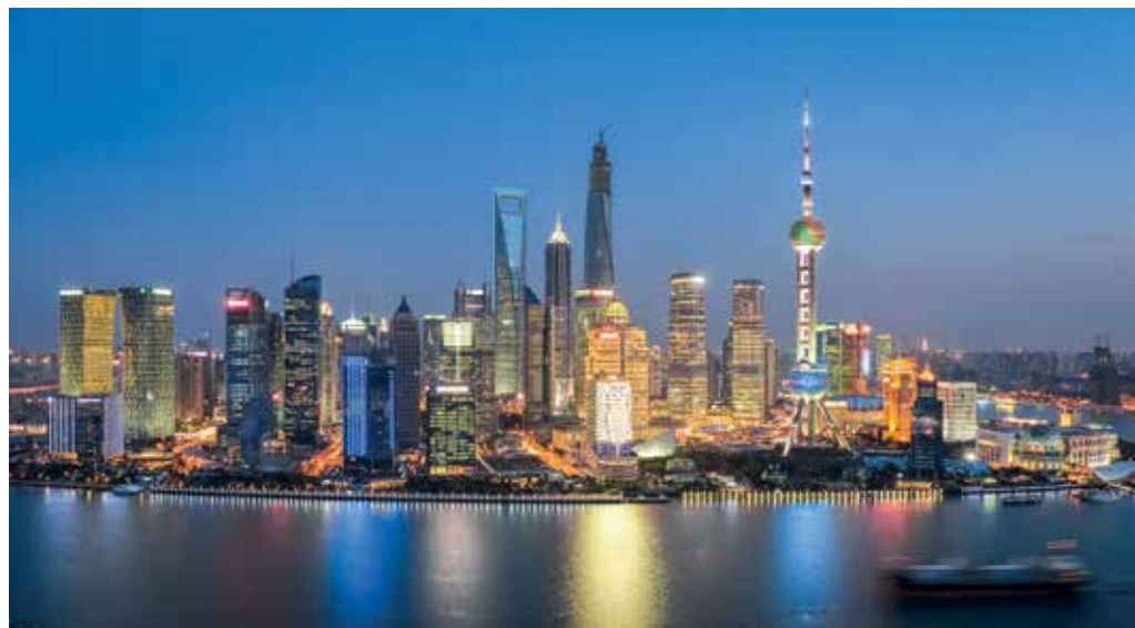
Blick vom Hafen aus auf die beeindruckende Skyline von Shanghai China ist kaufkraftbereinigt nun die weltweit größte Volkswirtschaft.

Lange Zeit war es erwartet worden. Ende 2014 teilte der Internationale Währungsfonds (IWF) nun mit, dass China kaufkraftbereinigt mit einer Wirtschaftsleistung von 17,6 Billionen USD diejenige der US-Wirtschaft (17,4 Billionen USD) überholt hat. Im Jahr 2005 betrug die Kaufkraftparität Chinas gerade einmal die Hälfte der USA. Das allein zeigt den rasanten Aufstieg Chinas in den vergangenen Jahren. Bei der Kaufkraftbereinigung wird das unterschiedliche Preisniveau für die jeweiligen Güter mit einbezogen. Rechnet man jedoch auf USD-Basis, liegen die USA noch etwa 70 Prozent vor China. Das Bruttoinlandsprodukt der USA pro Kopf ist sogar viermal größer als das des Reichs der Mitte. Aber China holt mit seinen nach wie vor hohen Wachstumsraten weiter auf.